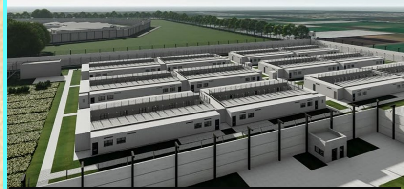
Maqueta de la futura Alcaldía

La nueva alcaldía contará con más de 3.500 m2, espacios al aire libre, zonas de circulación y áreas asegurativas, compuestas por 4 módulos, 32 celdas y 1 patio central.