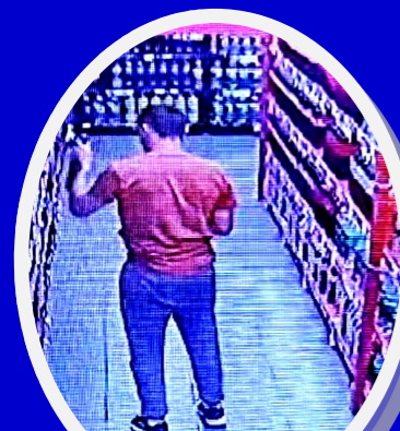
Momentos en el que una de las larvas roba bebidas del supermercado Fabián

Noticias de la Región tomó conocimiento que una banda de larvas tendría aterrada a la zona céntrica de la ciudad.