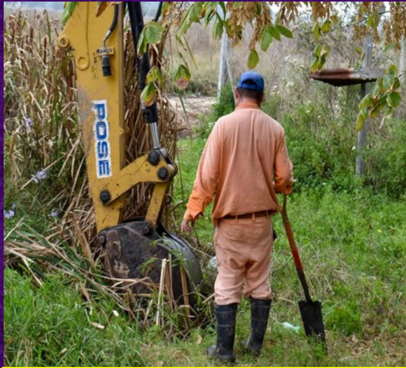
Maquina y personal municipal abriendo zanja donde alguna vez la hubo y hoy está totalmente tapada

A sabiendas que se avecinan fuertes tormentas para los próximos días desde la cartera de servicios públicos están poniendo especial énfasis a las limpiezas de sumideros, zanjas, canales y arroyos que forman parte del ejido sanvicentino, en la imagen se puede apreciar las máquinas y personal municipal trabajando contra reloj en calle Miguel Martínez de A. Korn, tareas que una vez finalizadas permitirá el rápido escurrimiento del agua del barrio y zonas vecinas.