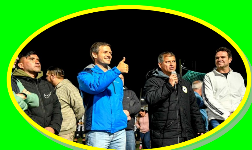
Defensores de Domselaar cuenta con luces led homologada por AFA

NUEVAS AUTORIDADES EN EL ANSES DE VERÓNICA