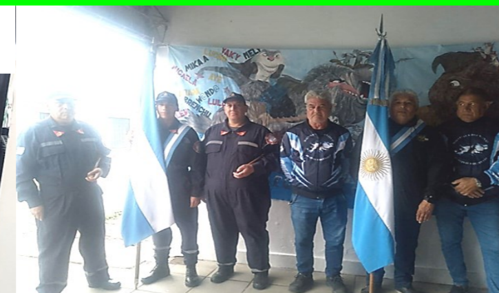
Héroes de Malvinas y Bomberos Voluntarios enalteciendo el acto

N° 739 Escúchanos en tu celular, bájate la aplicación * https://fmlaregion.com.ar * la 107.7 única emisora de habla hispana de la región