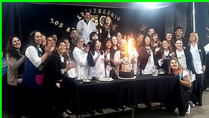
Personal de la E. P. N° 25 cantando el Feliz Cumpleaños

Acompañaron cómo es habitual nuestros *Héroes de Malvinas*, Bomberos Voluntarios, delegaciones educativas con sus abanderados y escoltas, grupos de danzas y vecinos del distrito.